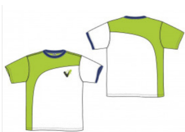
Camiseta manga corta dry Resto de Etapas