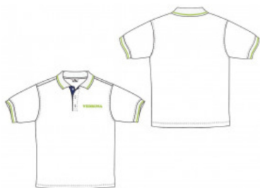
Polo manga corta