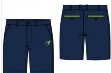
Pantalón corto adulto