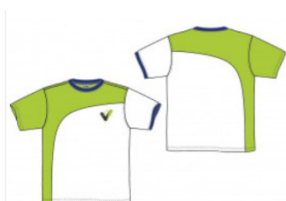
Camiseta manga corta dry Resto de Etapas

Las siguientes prendas serán obligatorias a partir del curso 2024/2025 para 1º, 2º y 3º de EDUCACIÓN SECUNDARIA . En esta etapa se usará la uniformidad deportiva. La llevarán los alumnos en los días que tengan Educación Física según el horario del grupo y cuando se realicen Actividades Complementarias que sean salidas, visitas o excursiones que así lo requieran.