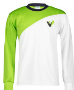
Camiseta manga larga dry