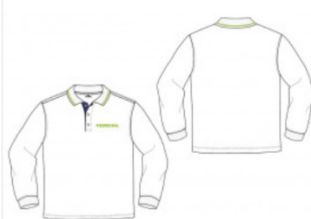
Polo manga larga