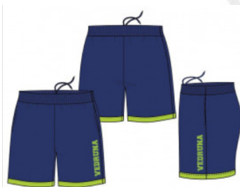
Pantalón corto deporte dry Resto de Etapas