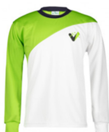
Camiseta manga larga dry