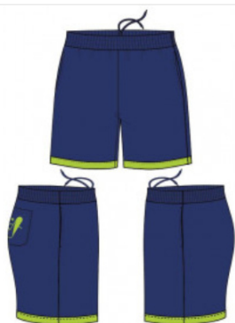
Pantalón corto deporte punto liso Infantil