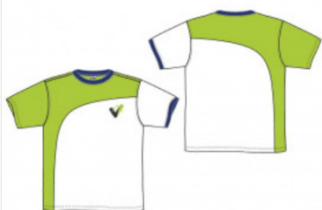
Camiseta manga corta punto liso Infantil

Las siguientes prendas serán obligatorias a partir del curso 2024/2025 para todos los cursos de EDUCACIÓN INFANTIL , 3, 4 y 5 años. Las prendas que llevarán serán las de la uniformidad deportiva todos los días de la semana . El BABY no se usará y se sustituye por el nuevo uniforme deportivo de INFANTIL .