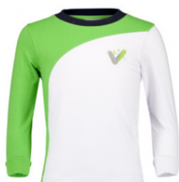
Camiseta manga larga Infantil