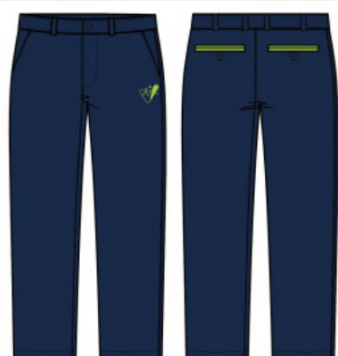
Pantalón largo niño